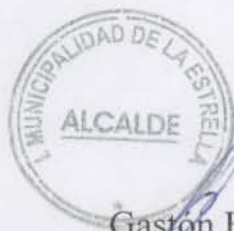
Gastón Fernández Mori Alcalde I. Municipalidad de La Estrella

Además de apoyar y estar de acuerdo con lo señalado en esta declaración, este municipio se compromete a trabajar en conjunto para que este proyecto se desarrolle íntegramente y logre el éxito esperado. Los compromisos del municipio son continuar realizando y mejorando las actividades de atracción turística que actualmente se efectúan en la comuna y se detallan en la declaración (Fiesta de la Querencia, Fiesta de la Chicha, Semana de la Cultura, Fiesta de San Nicolás de Tolentino), implementación en el corto plazo de un Plan de Desarrollo Turístico Comunal (PLADETUR) que genere los lineamientos y acciones necesarias para fomentar el turismo comunal, realizar Ordenanzas Municipales para el otorgamiento de patentes de servicios turísticos, y concretar convenio con SERNATUR para la capacitación de funcionarios municipales, empresarios y prestadores turísticos.